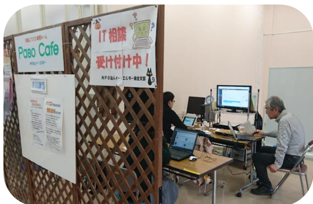
▲ショップスペースの使用例

プラザを拠点に、事務機能の強化&新しい活動にチャレンジしてみませんか？ 広報や団体運営のお悩みは、プラザのスタッフが強力サポートします！