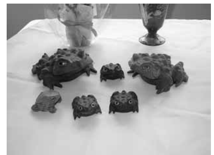
六匹の蛙 = むかえる = (お客様を)迎える