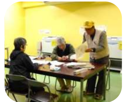
▲印刷機、紙折り機などが 使用できる「共同作業室」