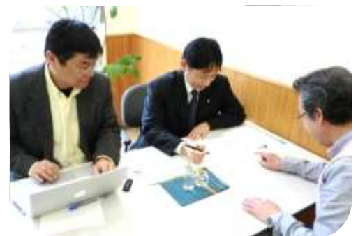
▲NPOの会計や組織運営など 専門家の相談