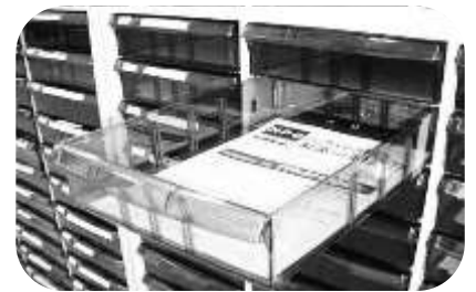
▲私書箱となる「レターケース」