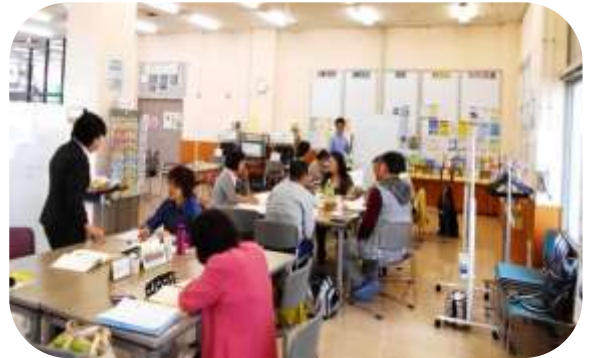
▲気軽に打ち合わせができる「交流サロン」