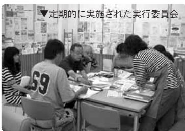
▼定期的に実施された実行委員会

今年のまつりでは新たな試みとして、みやぎNPOプラザに入居しているNPO(貸事務室、レストラン、ショップ使用団体)と、みやぎNPOプラザが「みやぎNPOプラザまつり2010実行委員会」を結成、「みんなでつくるみんなのまつり」を合言葉に各団体が役割を持って、企画・運営を行いました。ステージのサポート、会場の看板や装飾、来場者の呼び込み、受付など、実行委員会がそれぞれの得意分野を活かして担当しました。