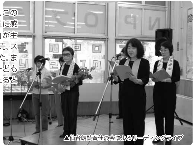
△仙台朗読奉仕の会によるリーディングライブ

10月17日(日)、「みやぎNPOプラザまつり2010」が開催されました。このまつりは、県内で活動するNPOの魅力をも市民に伝え、NPO活動を身近に感じてもらうことを目的に、「みやぎNPOプラザまつり2010実行委員会」が主催したものです。県内で活動するNPOなど29団体が、展示や体験、販売、ステージパフォーマンスで、日ごろの活動の様子や成果を発表しました。まつり当日は肌寒い曇り空でしたが、会場のみやぎNPOプラザには、子どもからお年寄りまで幅広い年齢層の来場者、約800名が訪れ、館内のいたるところに、にぎやかな声が溢れました。