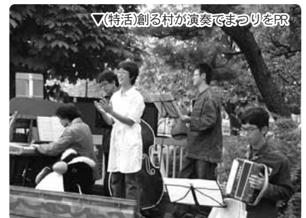
▽(特活)創る村が演奏でまつりをPR

盛況の内に幕を閉じた「みやぎNPOプラザまつり2010」ですが、様々な課題も見つかりました。そうした課題は、実行委員会でも検討される予定です。今後、それぞれの団体を運営する上での力となることでしょう。