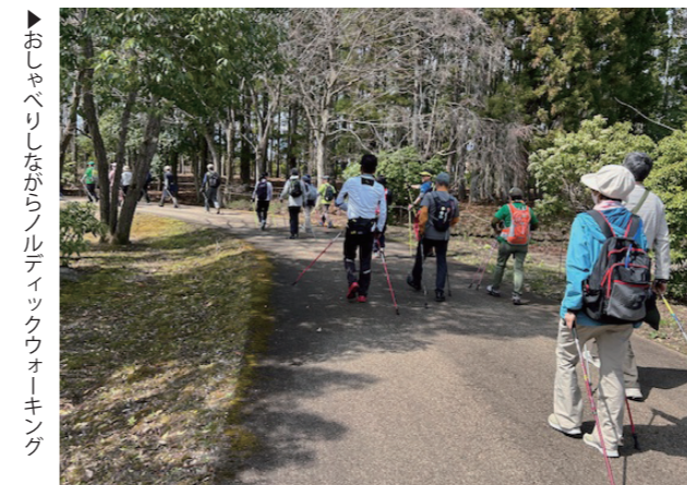
おしゃべりしながらノルディックウォーキング